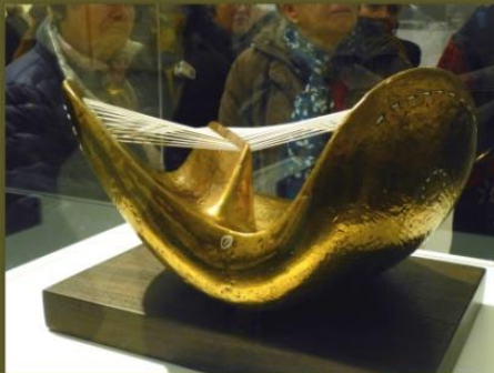
LA SCULPTURE EST UN ART DE FLEIN AIR.

La tentation de l'abstraction Abstraction