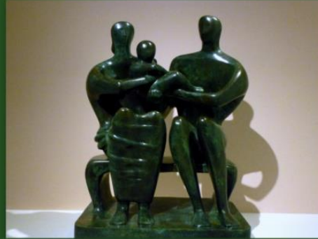
GROUPE DE FAMILLE 1946-47