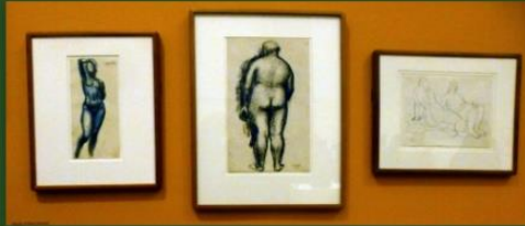
HENRY MOORE 1898-1986

Exposition Henry Moore (né le 30 juillet 1898 à Castleford (comté de Yorkshire) et mort le 31 août 1986 à Much Hadham (comté de Hertfordshire), est un sculpteur britannique. )